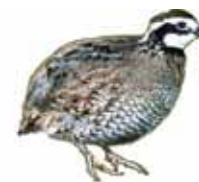
Caille des blés