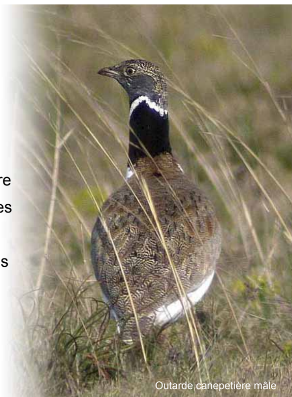
Outarde canepetière mâle

Les femelles vont pondre dans les hautes herbes à partir de mai. Les jeunes friches viticoles constituent des milieux de ponte idéaux.